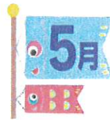
☆☆☆ 5月の予定表 ☆☆☆